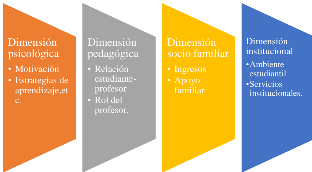
Figura 2. Algunos indicadores de las variables.

Fuente: (Tejedor & García-Valcárcel, 2007) (Garbanzo Vargas, 2007)