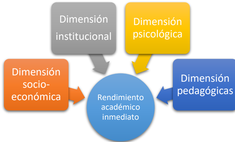
Figura 1. Dimensiones asociadas al rendimiento académico

Fuente: (Garbanzo Vargas, 2007) (Ayala & Atencio, 2018) (Tejedor & García-Valcárcel, 2007)